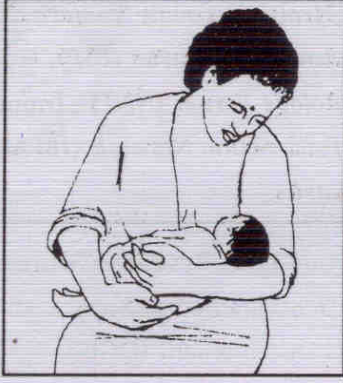
ಮಗುವನ್ನು ಎದೆಗೆ ಹಾಕುವ ಸರಿಯಾದ ರೀತಿ