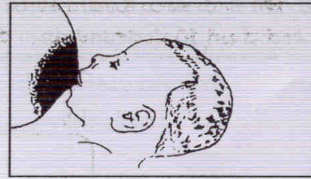
ತಪ್ಪಾದ ರೀತಿಯಲ್ಲಿ ಎದೆ ಕಚ್ಚಿರುವ ಚಿಹ್ನೆಗಳು