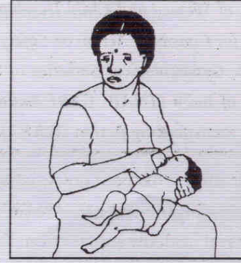
ಮಗುವನ್ನು ತಪ್ಪು ರೀತಿಯಲ್ಲಿ ಎದೆಗೆ ಹಾಕಿರುವುದು.