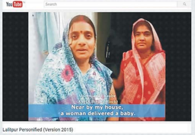
Lalitpur Personified (Version 2015)

తల్లిపాల సంస్కృతి, 2 సం॥లోపు పిల్లల పోషణ పద్ధతులు పెంపొందించడానికి తల్లులకు సమాజ స్థాయిలో సహకారం చాలా అవసరం. ఉత్తర ప్రదేశ్ రాష్ట్రం-లఖిత్పూర్ జిల్లాలో ప్రభుత్వ, ప్రైవేట్ సంస్థల సహకారముతో తల్లుల సహకార గ్రూపులు (Mother Support Groups) ఏర్పరచి వారి ద్వారా తల్లులందరికి తమ పిల్లలకు 2 సం॥ వయస్సు వరకు అందించవలసిన తల్లిపాలు మరియు అదనపు ఆహారము గురించి ప్రత్యక్షంగా సలహాలు, సహకారాల కార్యక్రమము నిర్వహించబడుతోంది. ఈ కార్యక్రమము పర్యవశానంగా జాతీయ కుటుంబ ఆరోగ్య సర్వే - 4 లో ఈ జిల్లాలో 71.3% పిల్లలు మొదటి 6 నెలల వయస్సు పూర్తికాలం తల్లిపాలు (Exclusive Breastfeeding) త్రాగుతున్నారు. ఉత్తర ప్రదేశ్ రాష్ట్రం మొత్తం మీద ఈ సంఖ్య 41.6%. దేశవ్యాప్తంగా ఇది 54.9%. ( https://www.youtube.com/watch?v=n8SQ-o6quug ) ఈ జిల్లా విజయాన్ని ఆదర్శంగా తీసుకొని ప్రతి జిల్లాలో సంబంధిత ప్రభుత్వ, ప్రైవేట్ సంస్థలు ముందుకు వచ్చి తల్లుల సహకార గ్రూపులు ఏర్పరచి తల్లులకు సహకరించవలసి ఉన్నది.